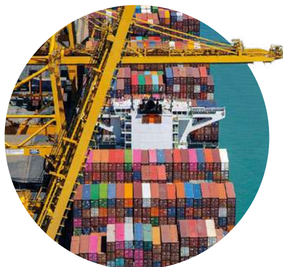
Vistas de la terminal de contenedores BEST del Puerto de Barcelona.

Los miembros del grupo de trabajo de Logística y Transporte visitaron la terminal de contenedores BEST del Puerto de Barcelona para conocer de primera mano cómo se realizan las operaciones de carga y descarga de trenes, camiones y buques. Asimismo, este puerto cuenta con una terminal de autopista ferroviaria, lo que lo convierte en un claro ejemplo de transporte multimodal, que gracias a la combinación estratégica de diferentes modos de transporte proporciona una solución eficiente e integral para la distribución de mercancías a nivel nacional e internacional.