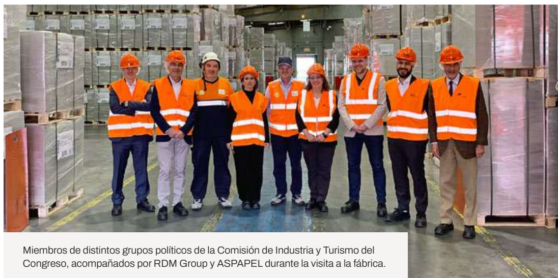
Miembros de distintos grupos políticos de la Comisión de Industria y Turismo del Congreso, acompañados por RDM Group y ASPAPEL durante la visita a la fábrica.

los parlamentarios recorrieron las instalaciones de la fábrica de RDM Group, donde pudieron profundizar en los procesos y retos del sector. La sesión culminó con una visita al Museo Molino Papelero de Capellades, donde los asistentes realizaron un recorrido por la historia del papel.