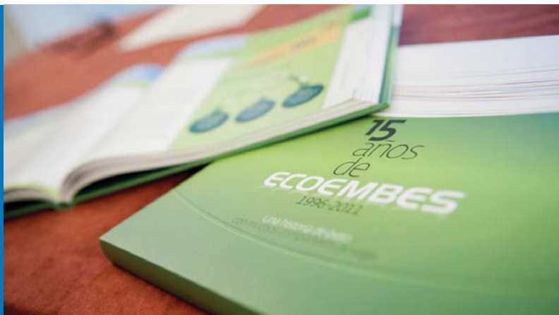
El libro 15 años de Ecoembes. Una historia de éxito con muchos compañeros de viaje , disponible en: http://www.ecoembes.com

Ecoembes cumple 15 años de éxito en la gestión de la recuperación y el reciclaje de los envases de plástico, metal y briks (contenedor amarillo) y papel y cartón (contenedor azul). Una historia de éxito con muchos compañeros de viaje es el título del libro, editado con ocasión de este aniversario, que compendia el nacimiento, evolución y desarrollo de la organización.